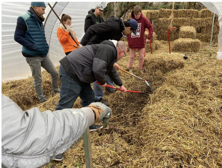
MJ Florennes - Mise en place d'un espace permaculture sous serre