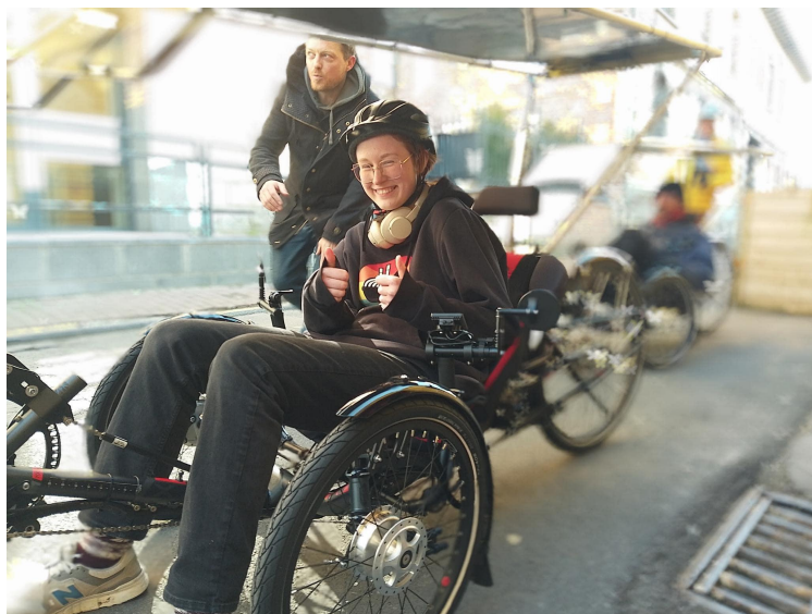
MJ Port'Ouverte - Création de deux vélos solaires