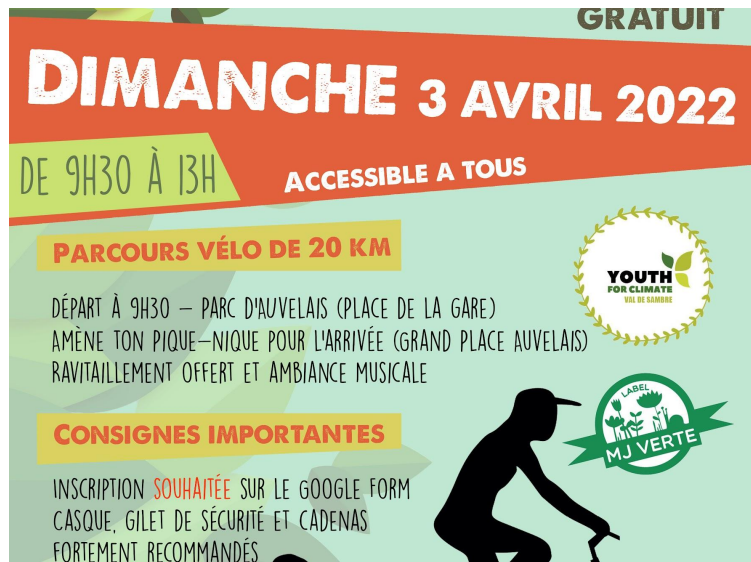
MJ Sambreville - Bike For Climate