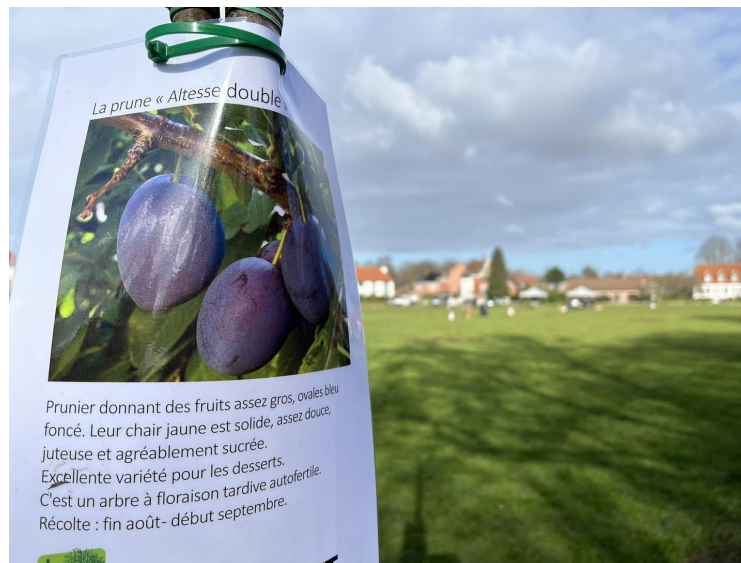
MJ Port'Ouverte - Plantation d'un verger