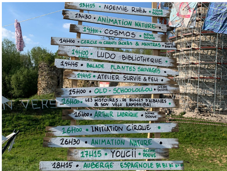
L'Amour en Vers - Festival Eco-Acoustique