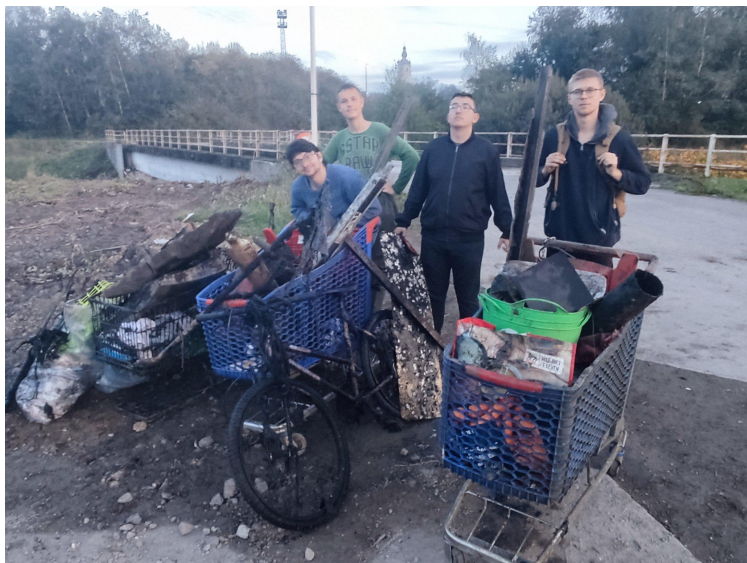
MJ Le Château - Nettoyage de rivière 'pêche à l'aimant'