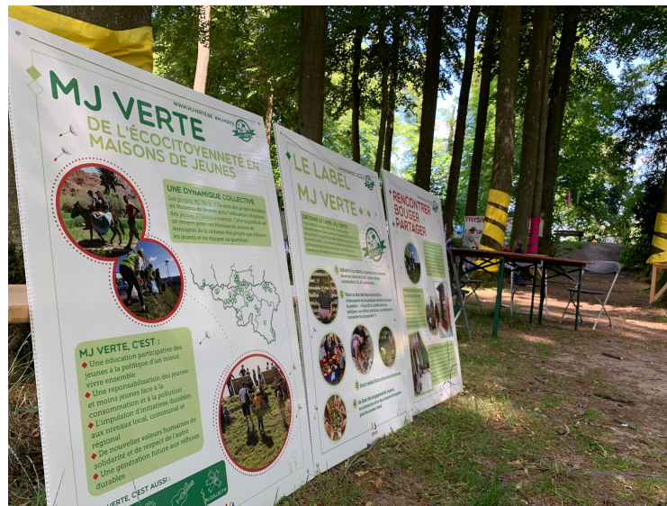
MJ Verte @ LaSemo