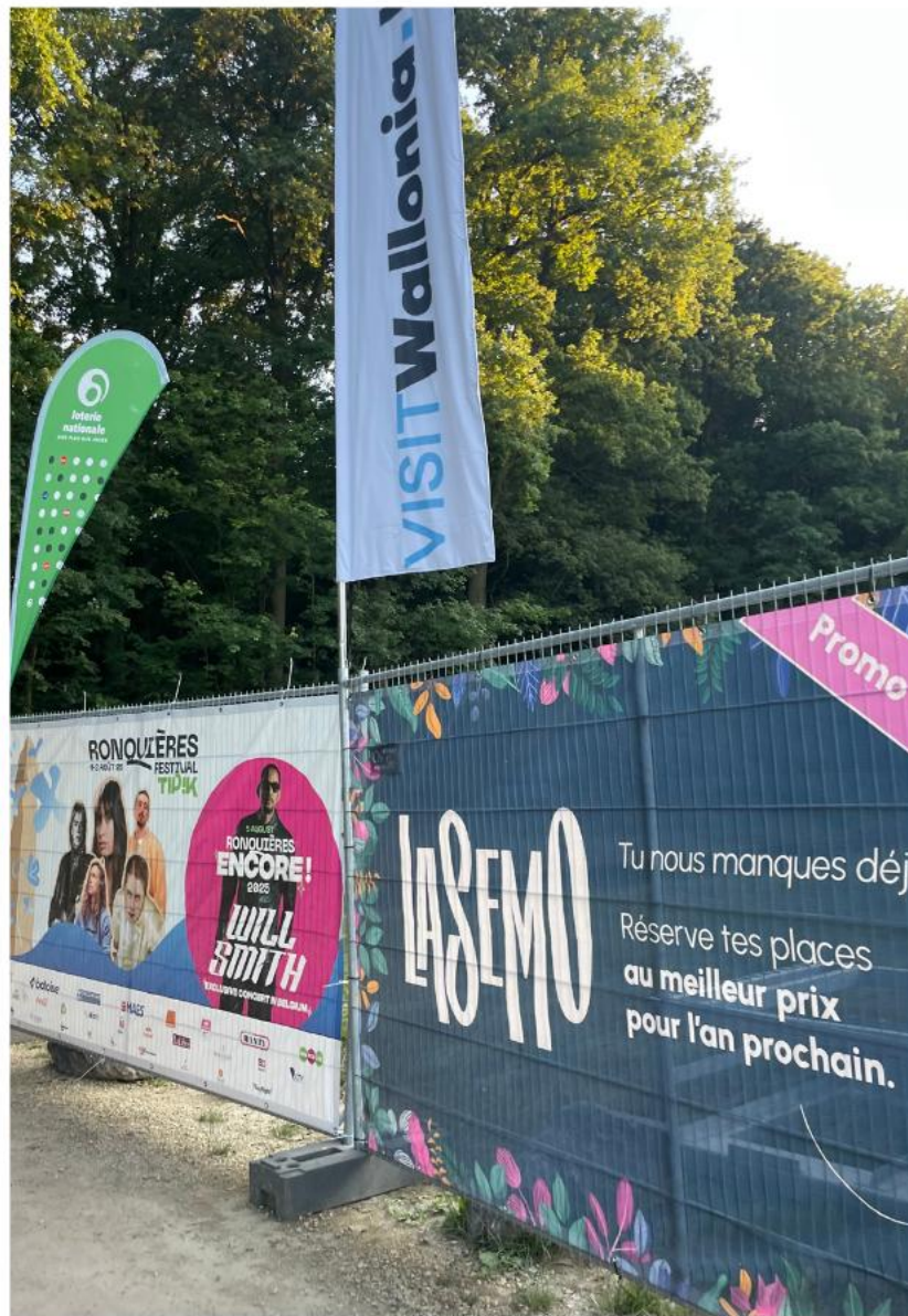
Partenaires & Visibilité